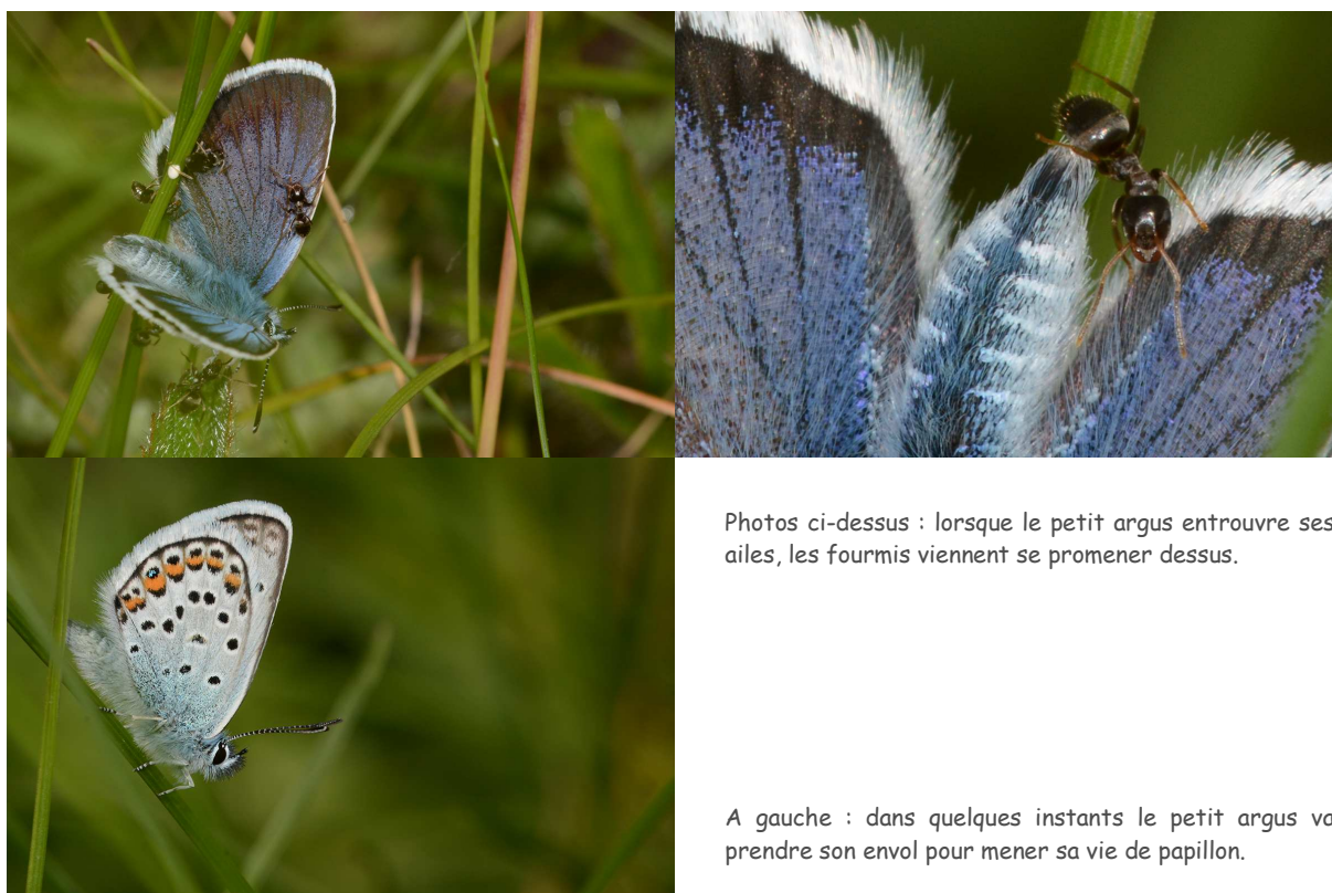
Photos ci-dessus : lorsque le petit argus entrouvre ses ailes, les fourmis viennent se promener dessus.

Le petit argus s'envole pour un vol plus long cette fois, soit environ deux heures après son éclosion. Sa vie aérienne de papillon commence à cet instant précis. Il va pouvoir partir à la recherche du nectar d'une fleur pour s'alimenter.